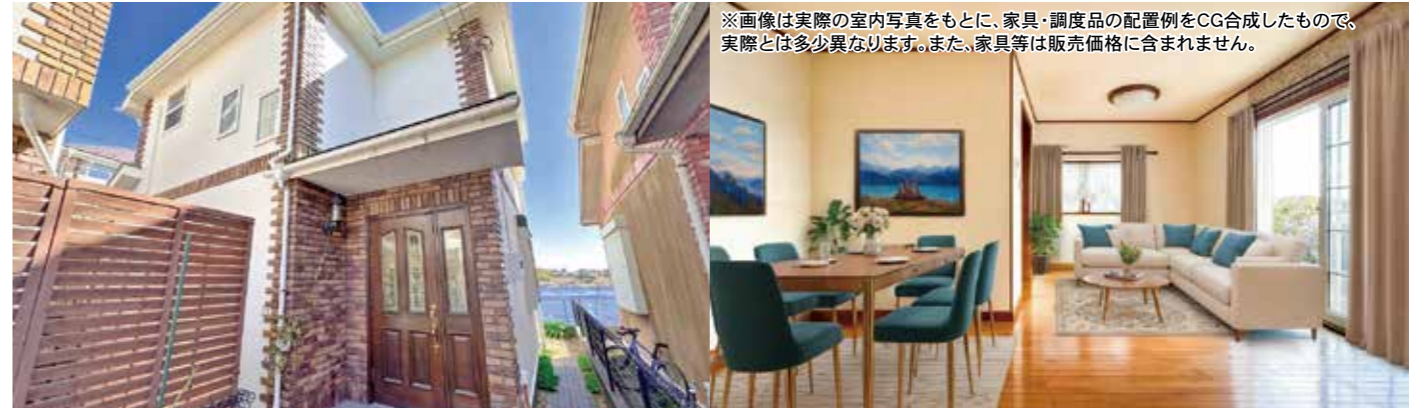
※画像は実際の室内写真をもとに、家具・調度品の配置例をCG合成したもので、実際とは多少異なります。また、家具等は販売価格に含まれません。